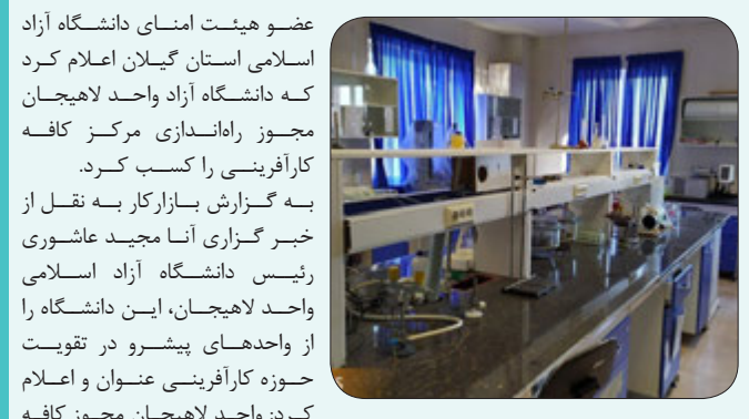
کارآفرینی در چارچوب مرکز مشاوره خدمات کارآفرینی را کسب کرد. برای دسترسی به جزئیات بیشتر به لینک زیر مراجعه نمایید