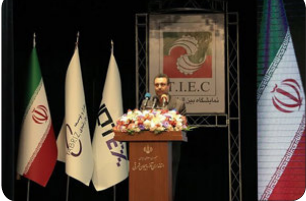
برای دسترسی به جزئیات بیشتر به لینک زیر مراجعه نمایید https://bazarekar.ir/45161