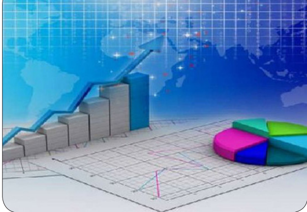
برای دسترسی به جزئیات بیشتر به لینک زیر مراجعه نمایید https://bazarekar.ir/45520