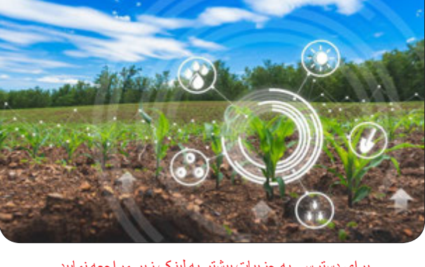
برای دسترسی به جزئیات بیشتر به لینک زیر مراجعه نمایید https://bazarekar.ir/45413