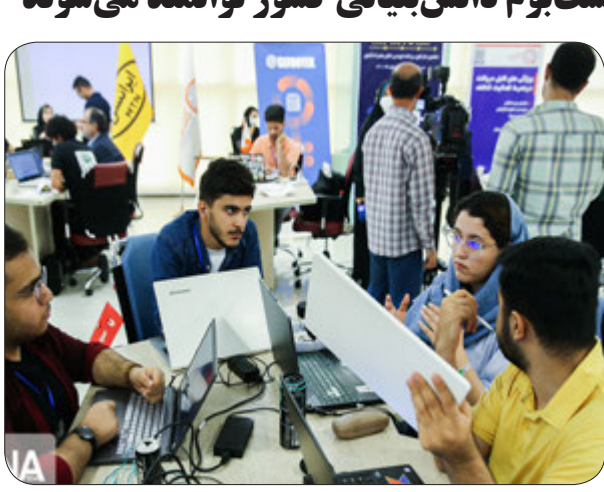
تبلینات و بازاریابی دیجیتال» و «کارشناسان فروش صنایع نوظهور و راهبردی» برگزار می شود.

معاون فناوری و نوآوری وزیر علوم تحقیقات و فناوری از ایجاد سه ناحیه فناوری در تبریز و برگزاری نمایشگاه رینوتکس به صورت ملی از سال آینده خبر داد. علی خیرالدین در مراسم افتتاحیه دهمین دوره نمایشگاه فناوری و نوآوری ربع رشدی از ۱۴۰۱ در تبریز، با اشاره به طرح تشکیل ستاد اقتصاد دانش بنیان در آذربایجان شرقی، افزود: اکنون این ستاد در تمامی استان های کشور برگزار می شود. به گزارش ایسنا، وی با بیان این که این نمایشگاه به صورت ملی برگزار شده و در تقویم فناوری کشور اضافه می شود، گفت: این نمایشگاه، دومین نمایشگاه فناوری کشور بوده که دیرینه آن در تبریز مستقر می شود. که امیدواریم به صورت بین المللی نیز برگزار شود. وی با بیان این که رابطه خوبی بین دستگاه های اجرایی آذربایجان شرقی، دانشگاه ها و پارک های فناوری استان ایجاد شده است، افزود: حدود ۵۰۰ واحد فناور و ۲۵۰ شرکت دانش بنیان در پارک علم و فناوری استان حضور دارند. حدود ۶۰۰۰ شغل دانش بنیان نیز فقط در پارک علم و فناوری ایجاد شده که نشان می دهد بستر خوبی برای اشتغال وجود دارد.